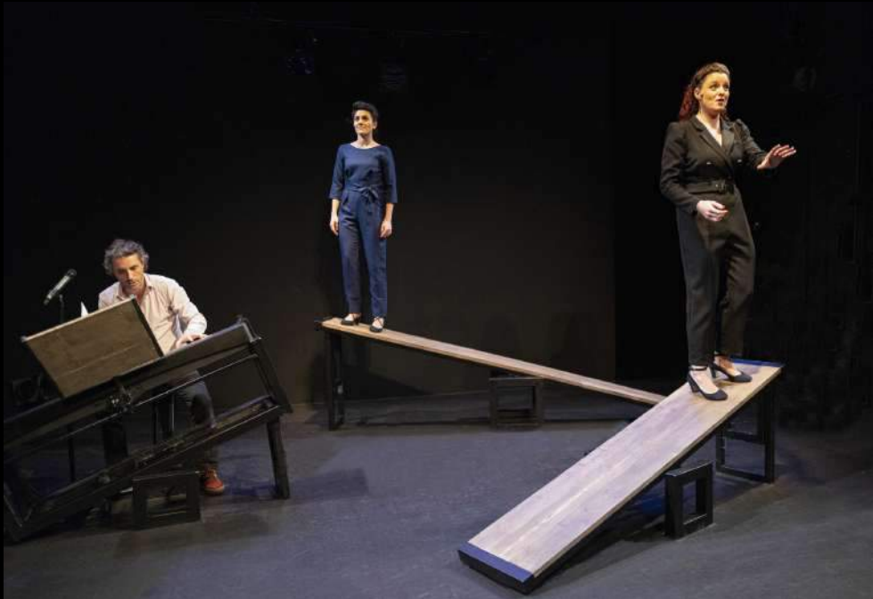
Présentation au Studio Hébertot, février 2021