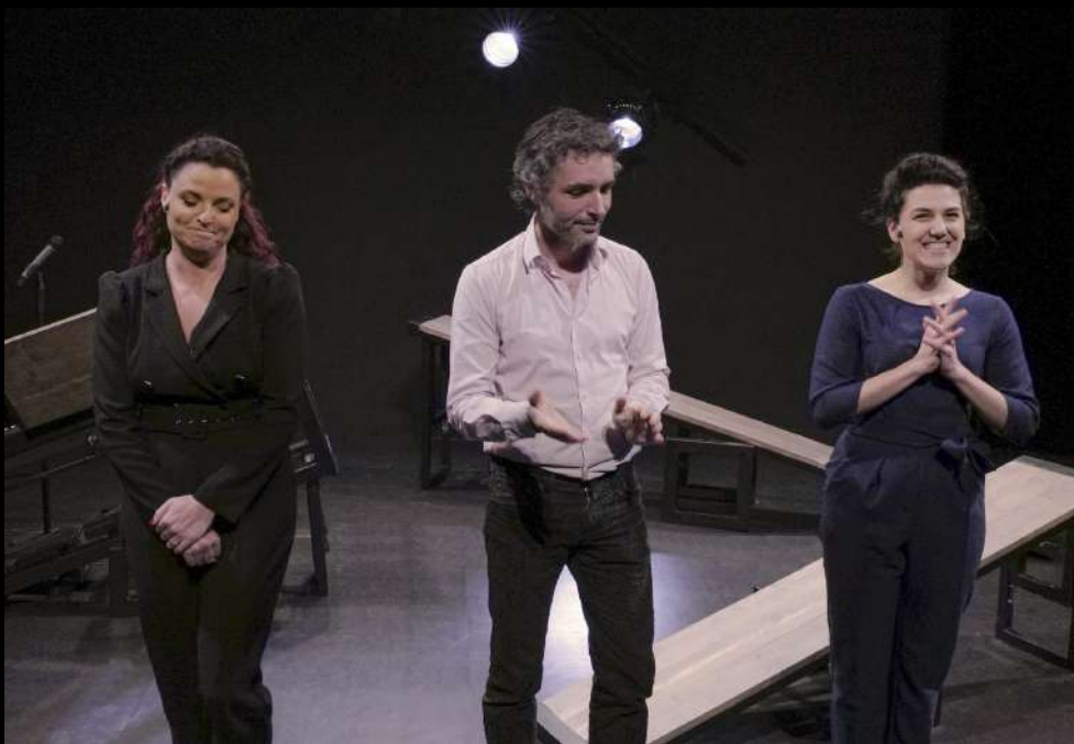
Présentation au Studio Hébertot, février 2021