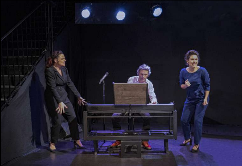
Présentation au Studio Hébertot, février 2021